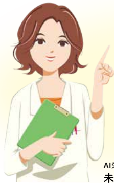
AI栄養士 未来(ミキ)さん

スマートフォンのアプリやPCから食事内容を登録すると、その都度詳細な栄養レポートと栄養士からの食生活改善アドバイスが受けられるサービスです。