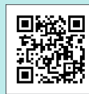
KENPOS スマホ用 QRコード